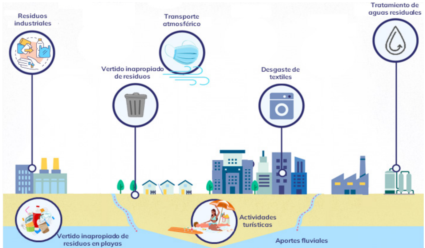
Figura 1. Fuentes de ingreso y transporte de microfibras en los ecosistemas marinos. Modificado de Fernández (2021).

En un contexto en el que la contaminación por microfibras sigue incrementando su relevancia, es imprescindible detectar sus principales fuentes de producción y promover la comprensión entre las prácticas de consumo del sector textil y la industria de