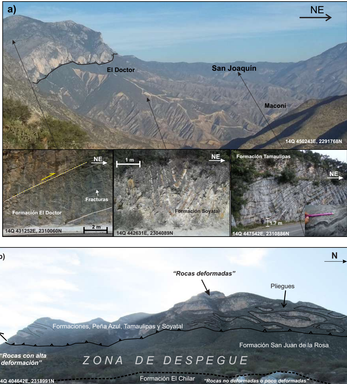
Figura 1. Vistas panorámicas de la Sierra Gorda de Querétaro. En los alrededores del poblado de San Joaquín (a) se puede ver a las rocas deformadas correspondientes al interior de las montañas, la cuales se encuentran plegadas y fracturadas. En una vista panorámica de las montañas al norte del poblado de Tolimán (b), se puede observar a las rocas de la formación San Juan de la Rosa que representan la zona de despegue o la raíz de las montañas. Esta zona de despegue separa a las rocas deformadas del Cretácico Medio-Tardío (Formaciones geológicas Peña Azul, Tamaulipas y Soyatal) de rocas poco deformadas del Triásico Tardío (Formación El Chilar). Las coordenadas en las fotografías están en el sistema UTM-WGS84 cuadrante 14 Q.

Consideramos que tanto el primer video que se presenta en este trabajo como los futuros videos de la serie “Explorando la Sierra Gorda de Querétaro” son adecuados para alumnos de nivel medio. Se incluye un glosario de términos que pueden ayudar a comprender mejor lo que se trasmite en el video. Así mismo, los videos pueden llegar a ser una herramienta de enseñanza en las universidades donde haya carreras relacionadas con Ciencias de la Tierra. Finalmente, también creemos que puede ir dirigido al público adulto general ya que es un tema de interés para las personas que viven dentro de las cadenas montañosas en el mundo, como la Sierra Madre Oriental.